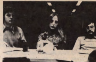
zijn en daaraan is het moeilijk iets tegen te doen.

Das is nu niet te voorspellen, maar toch zal waarschijnlijk elke partij meer waarde krijgen in haar eigen gebied. Nu is de BSP in Vlaanderen de 'lakei' van het machtige PSB-blok in Wallonië en de PSC het zwakke broertje van de CVP ... maar dan zal de BSP in Vlaanderen veel sterker staan en beter kunnen ageren als eigen groep. Doch weer eens, het zijn de vakbonden als grote machtslobby's die heelwat gevaarlijker