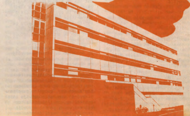
Campus Arenberg III is gelegen aan de overkant van de Geelstijnenlaan in Heverlee, op meer dan één kilometer van enig kafé, winkel of restaurant.

Het veelvuldig gebruik van het kafetaria vóór 1976, wijst er op dat de behoefte er wel degelijk is. De Raad van Studentenvoorzieningen ging hier algemeen genomen, mee akkoord, maar zag zich gekonfronteerd met een aantal vragen en problemen: