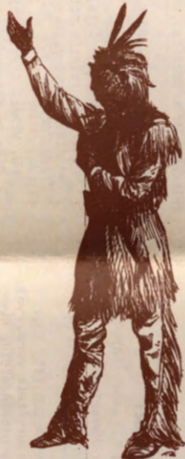
BANAI (Belgisch Aktiekomitee voor Noordamerikaanse Indianen) SKAL

Om hun strijd moreel en financieel te steunen worden er over de hele wereld solidariteitsacties ondernomen t.v.v. dit bedreigde volk. Hierin kadert deze benefietavond, opgezet door: