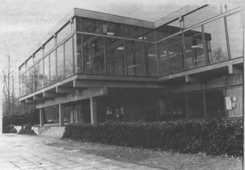
ALMA III — Ondanks de lange wachttijden blijven de ruiten gaaf in Alma III.