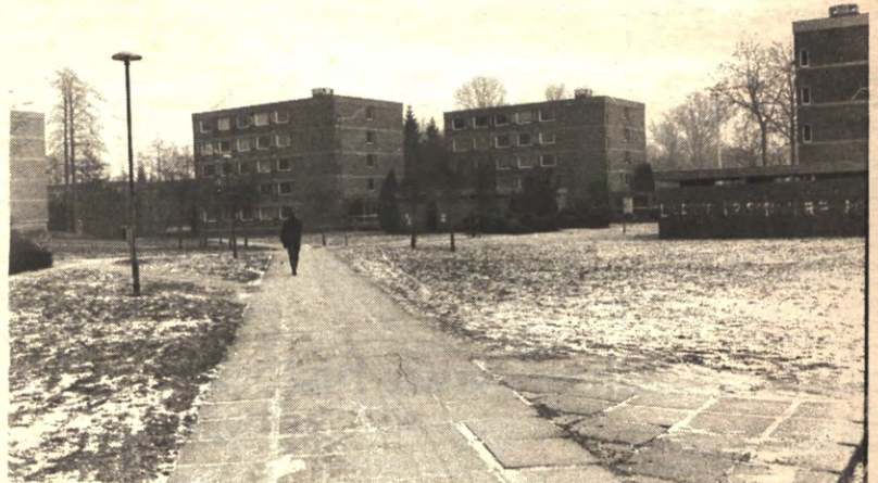
HEVERLEE — Na ons heerlijk voorproefje vorige week wisten we dat u niet langer kon wachten. Wij doken onder in Heverlee, zie pagina's 4, 5 en 6.

voordelen aan de gezinnen voor studerende en de bestaande studietoelagen. Wanneer men dat doet, komt men op ongeveer 60.000 BF per student per jaar.»