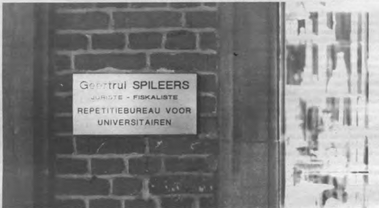
Achter dit plaatje gaat onvermoede wijsheid schuil. Maar wat is de weetbegeerte in het licht van de eeuwigheid?

Het 11.11.11-projekt van Leuven vinden wij dan ook een gelukkige keuze. 11.11.11 steunt een Derde Wereldland dat - met wisselend succes - van 'streven naar rechtvaardigheid' een reële beleidsopie maakt. Vandaag, na verschillende jaren oorlog, is die steun aan Nicaragua meer dan ooit nodig. 11.11.11-Leuven heeft een zinnige en actuele keuze gemaakt. De opmerkingen dat zo'n 11.11.11-kampagne 'rode propaganda' is, getuigt dan ook van veel simplisme, het simplisme van zij die hebben en weinig willen geven.