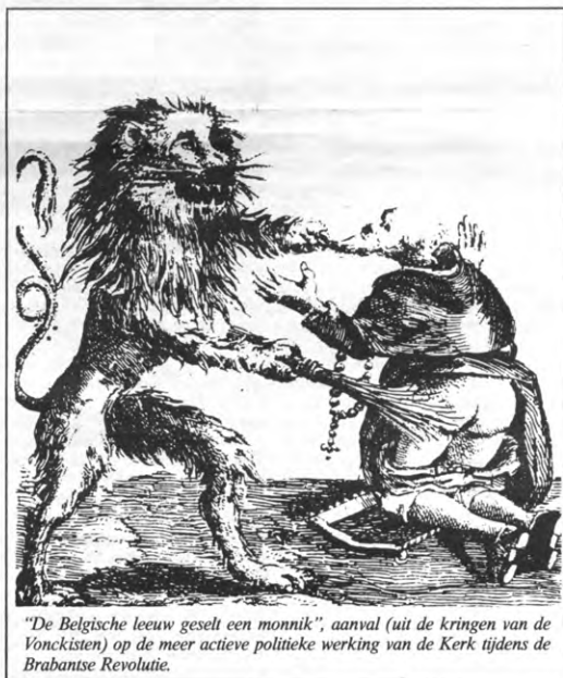
"De Belgische leeuw geselt een monnik", aanval (uit de kringen van de Vonckisten) op de meer actieve politieke werking van de Kerk tijdens de Brabantse Revolutie.

De bredere lagen van de bevolking kwamen echter pas echt in het geweer toen de hervormingswoede ook het politieke en juridische establishment aanpakte. De traditionele lokale machthebbers en de mistervreden klerus sloegen de handen in elkaar. Via formele protesten in de Staten van Brabant en Henegouwen slaagden ze er in april-mei 1787 in de 'ongrondwettelijke hervormingen' door de gouverneur-generaal te doen opschorten. Jozef II bleef evenwel onwrikbaar. Om weer orde op zaken te stellen, stuurde hij een hard militair, generaal d'Alton, naar de opstandige gewesten. Die kreeg de situatie weer onder controle, behalve in Leuven, waar