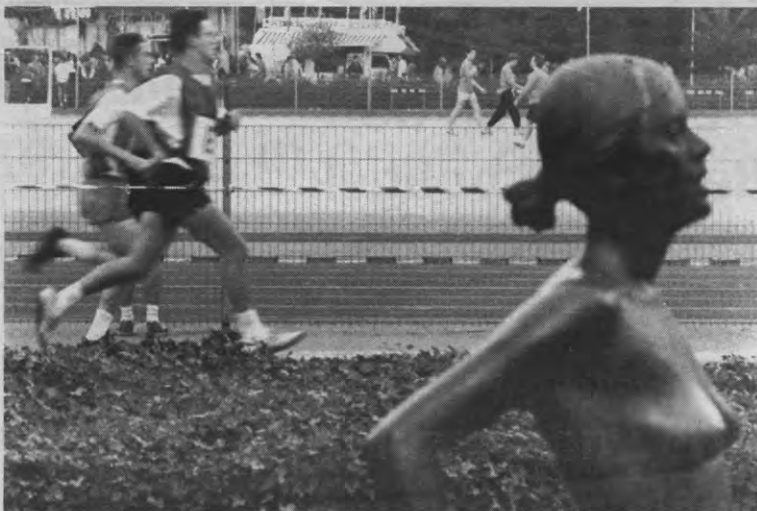
Opzij, opzij, de muzelmannen komen.