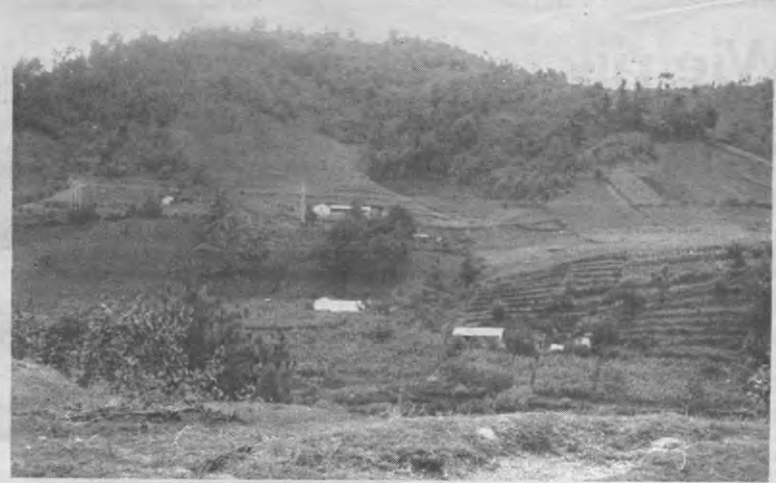
Midden-Amerika: bananerepublieken, of de lushof van de VS?

In theorie betekende de oprichting van het Stabex-compensatiefonds dus een stap in de goede richting. In de praktijk zijn de financiële mogelijkheden van Stabex ruim onvoldoende. Vooral de jaren '80 waren voor de grondstoffenafhankelijke landen een moeilijke tijd. Zo leed in 1986 Sub Sahara Afrika (het deel van Afrika ten zuiden van de Sahara) door de aanhoudende prijsdalingen een verlies van 19 miljard dollar, of viermaal het bedrag dat het dat jaar aan noodhulp binnenkreeg. En in 1987 liepen de