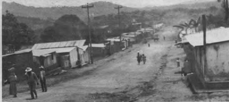
Nicaragua: al 22 partijen op de lijst voor de verkiezingen van 1990.

Hoewel de economische resultaten van de Sandinisten in de eerste jaren na de onafhankelijkheid zeer bemoedigend