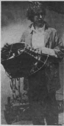
Vijf van haar schilderijen, die geïnspireerd zijn op het woeste Schotse landschap, beheersen achtereenvolgens het decor en fungeren als rode draad doorheen het verhaal. Ze zijn getiteld Rest and Remember , St-Palais Sur Mer , Hoveniersbrug , Het Paradijs en De Muur . 'Rest and Remember' is 'een spreuk met de kracht van een bezwering, die ze op de rug van een bank langs één van haar wandelpaden vond'.