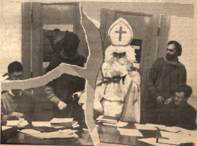
SINT - Een hartverscheurend moment voor al wie het mocht meemaken. Loko schreef weer geschiedenis. Of denken ze dat maar? Een kat in de zak op pagina drie.

Afgifte Leuven X (weekblad - verschijnt niet van juni tot augustus)