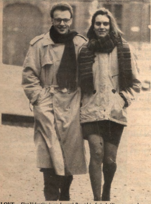
LOVE - Sint-Valentijn is op komst! Bereid je fysisch (!) en mentaal voor en plaats in de Veto van maandag 12 februari 1990 een valentijn-zoekertje. Voor het bedrag van zestig frank mag je elk vakje van het valentijn-rooster (op bladzijde 7) kleuren. Moge dit initiatief het begin zijn van een gelukkige en voorspoedige relatie.