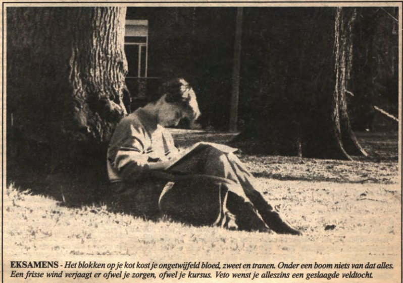
EKSAMENS - Het blokken op je kot kost je ongetwijfeld bloed, zweet en tranen. Onder een boom niets van dat alles. Een frisse wind verjaagt er ofwel je zorgen, ofwel je cursus. Veto wenst je alleszins een geslaagde veldtocht.

Pagina 7: Jommekes' sado-erotische dromen over de Miekies, zijn kastratie-angst voor Flip's snavel, zijn oedipus-kompleks jegens Theofiel, zijn homo-seksuele relatie met de androgyne Filiberke, de travestie van Anatool, diens interesse voor Foucault. Lézen!