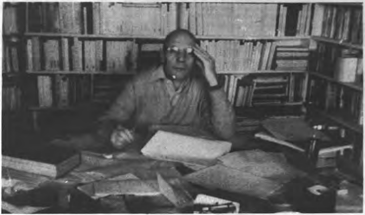
FOUCAULT - De man die het altijd zag zitten.