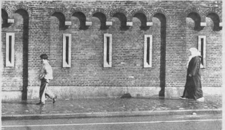
Uiteindelijk zal het toekennen van algemeen stemrecht er toe leiden dat de migranten veel meer belangstelling voor de gemeente zullen tonen en bijgevolg meer burgerzin zullen ontwikkelen.