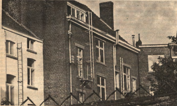
Wie hier op kot zit, is bij de gelukkigen: hij zal niet verkolen, verstikken of van de derde verdieping te pletter storten voor de 100 arriveert.

STUDENTENWEEKBLAD VAN DE LEUVENSE OVERKOEPELENDE KRINGORGANISATIE - JAARGANG 17, 1990-1991, NUMMER 29, MAANDAG 13 MEI 1991