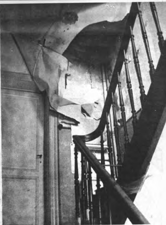
Wie hier niet op kot zit, is bij de gelukkigen: hij zal niet door de derde verdieping te pletter storten voor de kommunisten arriveren.

Ook uit de formulieren voor studio's en residenties blijkt dat de opstellers deze belangrijke vraag beter anders opgevat hadden: hier laten nogmaals 59% en 57% de vraag open. Het is dan ook moeilijk te zeggen in hoeverre de kritieken kwa geluids-, stank-, en vochtoverlast op die categorieën van toepassing zijn. Enkel voor 'geluidsoverlast binnenhuis' wordt nog redelijk geskoord: in beide gevallen ongeveer 16% van de ondervraagden.