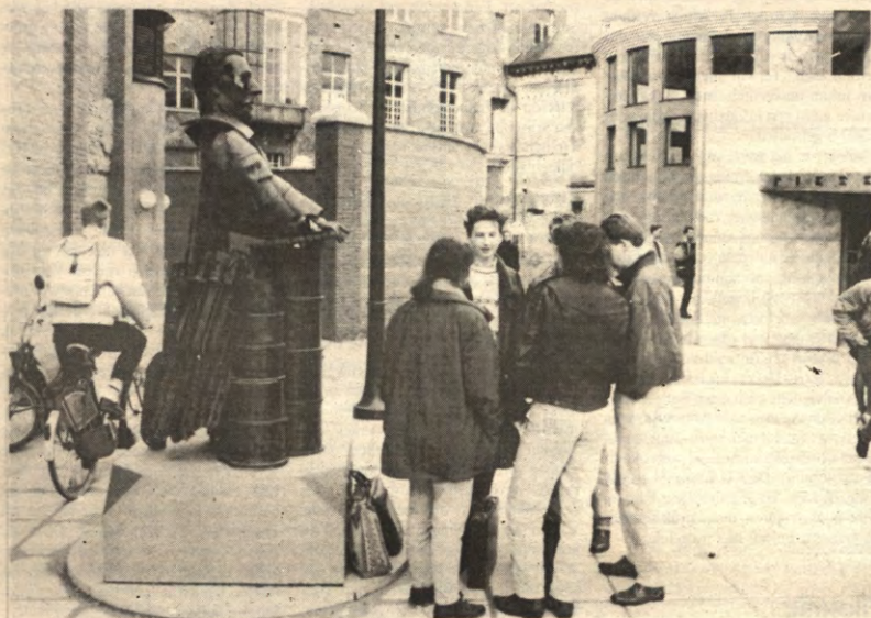
In elitair gezelschap.

STUDENTENWEEKBLAD VAN DE LEUVENSE OVERKOEPELENDE KRINGORGANISATIE - JAARGANG 18, 1991-1992, NUMMER 7, DINSDAG 12 NOVEMBER 1991