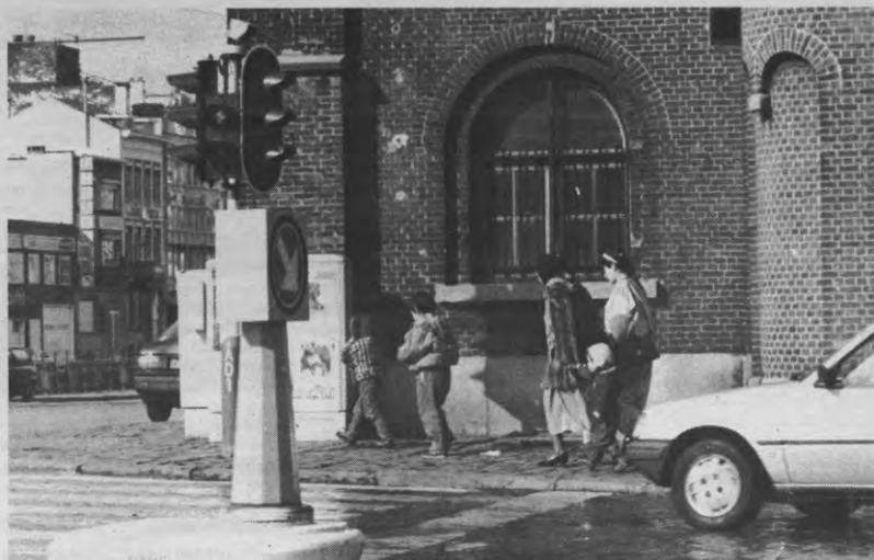
Opgepast! Achter elke hoek schuilt het gevaar.

Eens de aanvraag ontvankelijk verklaard, gaat het dossier naar het Hoog Commissariaat voor de Vluchtelingen die het grondheidsonderzoek op zich neemt. Het Hoog Commissariaat velt zijn oordeel voornamelijk op basis van de coherentie van het voorgestelde verhaal van de vluchteling. Wie de tweede ondervraging een ander verhaal ophangt als de eerste keer, valt natuurlijk door de mand. Ook bijvoorbeeld de commerciële Ghanese circuits die foto's en verhalen tegen een hoge prijs verkopen aan kandidaat vluchtelingen, zijn overbekend op het Commissariaat. Gemiddeld worden er zo'n vijftien procent van de kandidaat vluchtelingen ook erkend.