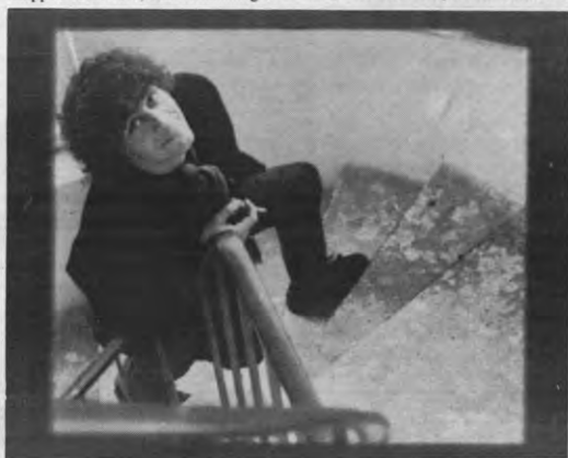
Spiegelgje, spiegelgje aan de wand.

Tentoonstelling 'Nieuwe Namen' met foto's van De Spiegelaere en Claus in CC De Borre, Bierbeek, doordlopend tot december.