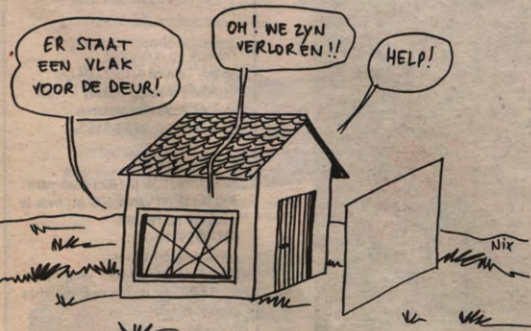
HdR en VRG zoeken moeizaam naar een vergelijking, zie p.5