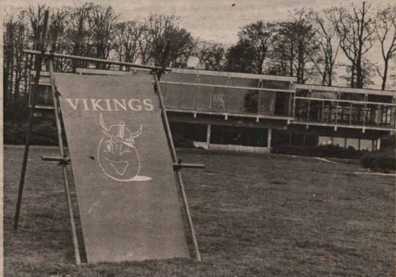
De Daltons hebben verloren. Maar liever dat nog, dan dit bord voor je kop van de zakenman...

Terwijl de zoekertjes ongeveer even talrijk blijven, ook nu de examens naderen, is de ad valvas-rubriek van Veto 28 wat mager uitgevallen. Slechts twee kringen deden de moeite om ons afgelopen week te informeren over hun aktiviteit(en). Natuurlijk werkt er niet meer zoveel georganiseerd als in oktober of in februari, maar zo weinig? Op pagina 7.