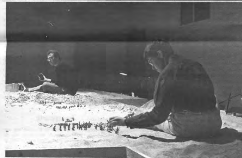
Zijn zij uitgeput door dysenterie? De toeschouwer, "deelgenoot aan het spektakel", is alsleziens gewaarschuwd.