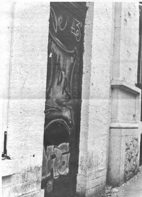
HdR: Honderd dronken Rukkers?