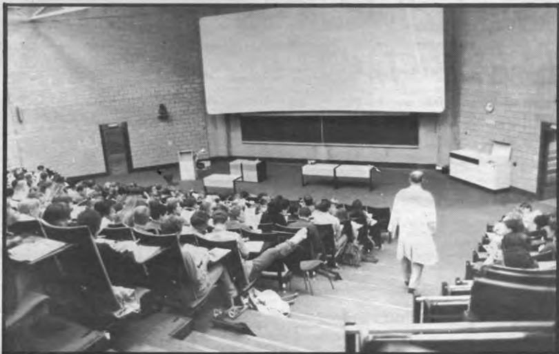
Erasmus is en blijft te veel beperkt voor enkele fakulteiten