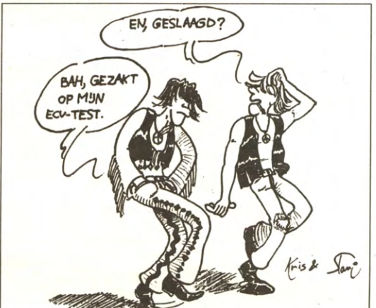
Voor wie ook maar een beetje geïnteresseerd is in Onderwijsproblematiek, is het debat van Kringraad een must. Lees onze artikelen op pagina 2 en 3.