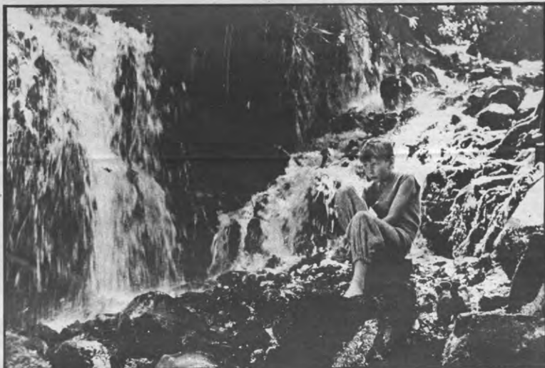
Daens' jonge jaren

'Vinaya', van 25 maart tot en met 1 april, Stuc, voor precieze tijdstippen Stucboekje lezen