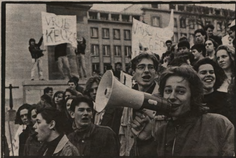
Wie schreewt er het hardst? Zie pagina 3