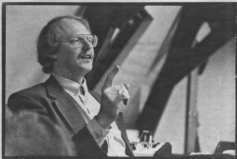
Dit is nu een linguïst.

ren Blommaert en Verschuieren ook terug te vinden in minder expliciet Europa-ophemelende teksten. "Het superioriteitsgevoel dat gepaard gaat met de vanzelfsprekendheid van het vertrouwen in de Westerse levensstijl en waarden, vinden we terug tot in de nobelste en meeste goedwillende pogingen om tolerantie ten toon te spreiden en een multicultureel perspectief te propageren." Voorbeelden zijn hier legio: sommige films van de Leuvense organisatie 'Bevrijdingsfilms', teksten van sommige politieke partijen zoals Agalev, goedbedoelde lezersbrieven in kranten, projecten van migrantencentra. Op het einde van het boek krijgen ook de rapporten van Paula D'Hondt en wetenschappelijke onderzoeken van Jaak Billiet (KU Leuven) een flinke veeg uit de pan.