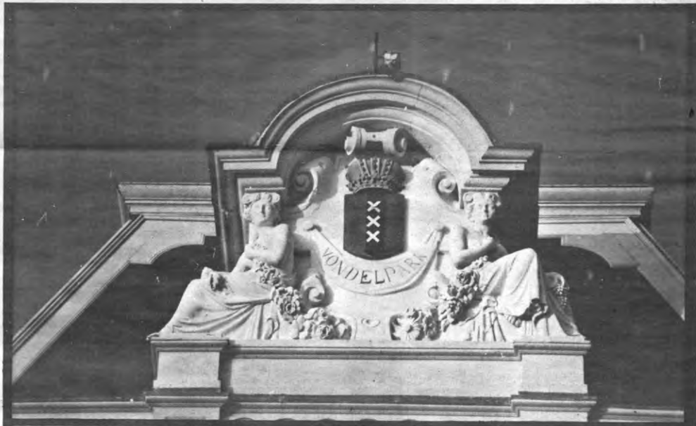
Neem nu het Vondelpark: honderden witte kippen hebben hier getript op Loesie in de Skaai wid Daaimonts. Behoorlijk intimistische aksies, als je het mij vraagt.

Provo en Oranje Vrijstaat brachten vanaf