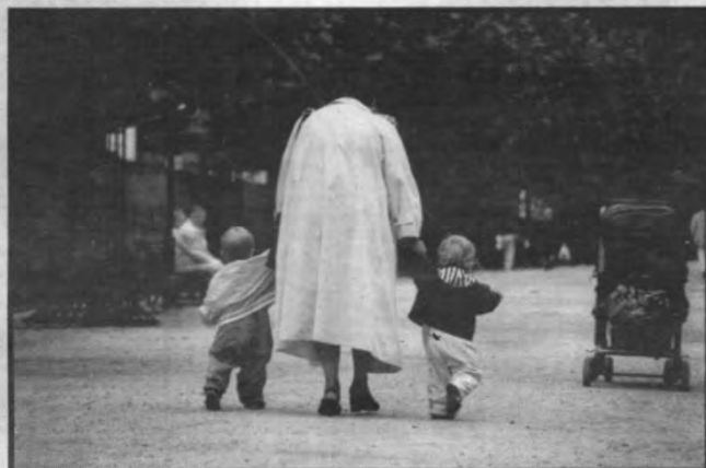
Oh, it's such a perfect day!

best advies aan de klimatoloog. Dat is de man die, steunend op de gegevens van jarenlange waarnemingen, kan voorspellen of bepalen hoe ergens het klimaat evolueert of stagneert. De weerkundige daarentegen staat onder veel meer stress. Hij wordt beoordeeld op zijn voorspelling van de dag voordien.