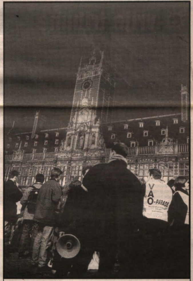
Alles over de VAO-betoging op pagina 3.

Ook de Marxistisch Leninistische Beweging (MLB) werd met een vrij ruime meerderheid, vijftien tegen drie, het recht op subsidies ontzegd. Hen wordt ideologisch revisionisme en rekuperatie van betogingen aangewreven. Een kringvertegenwoordiger van Eeos verweet de MLB op gespreksavonden historisch bewezen feiten te ont-