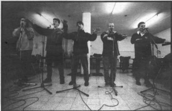
Aanstaande woensdag treden deze studenten op in Cultureel Centrum Minnepoort. Het gaat hier om de Limburgse a capellagroep 'Toontje Hoger': zij graaien er uit hun rijkgevuul repertoire met klassiekers als 'only you' van The Platters, het ellenlange 'longest time' van Billy Joel, het 'zeinzoete' 'more than words' van Extreme en het onvermijdelijke 'only you' van the flying Pickets.

Je kan dit briefje opsturen of gewoon even langskomen of bellen naar het Sportraadsekretariaat, Tervurenvest 101, 3001 Heverlee (tel: 32.91.33, fax: 32.91.99)