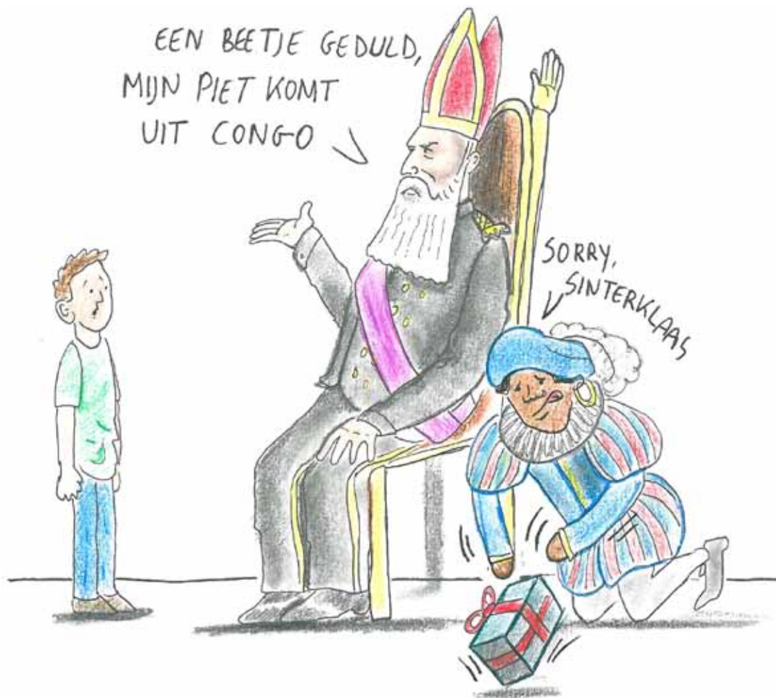
CARTOON Martijn Stoop

Kan de traditie dan niet evolueren, zoals het debat in Nederland voorstelt? “Dan rijst de vraag natuurlijk of het dan nog traditie is. Het authentieke moet wel aanwezig blijven,” aldus Potemans. “Waar je die grens trekt, is arbitrair.”