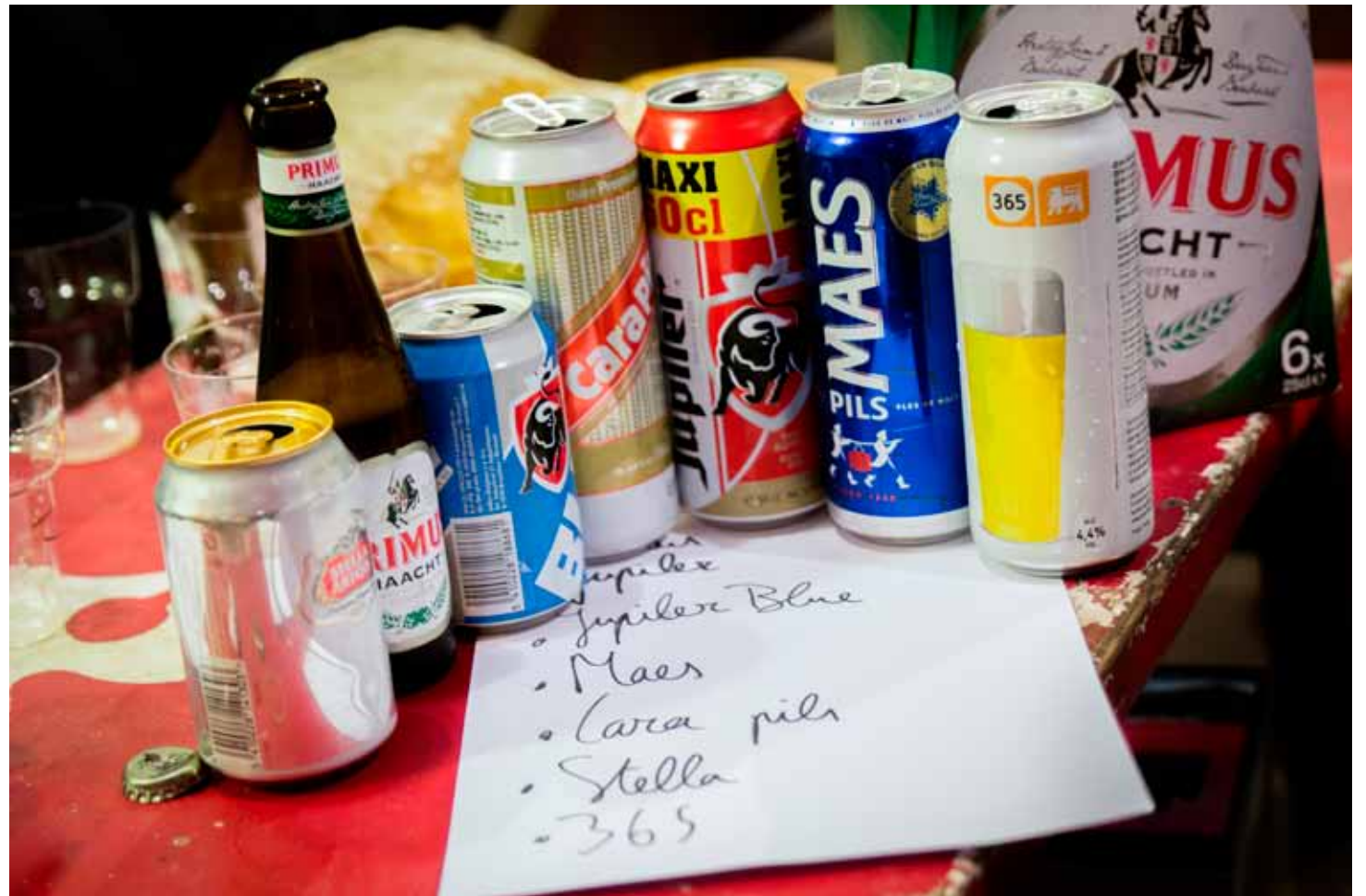
“Ja, dat smaakt naar bier hé,” weet een connaisseur over Carapils te vertellen.