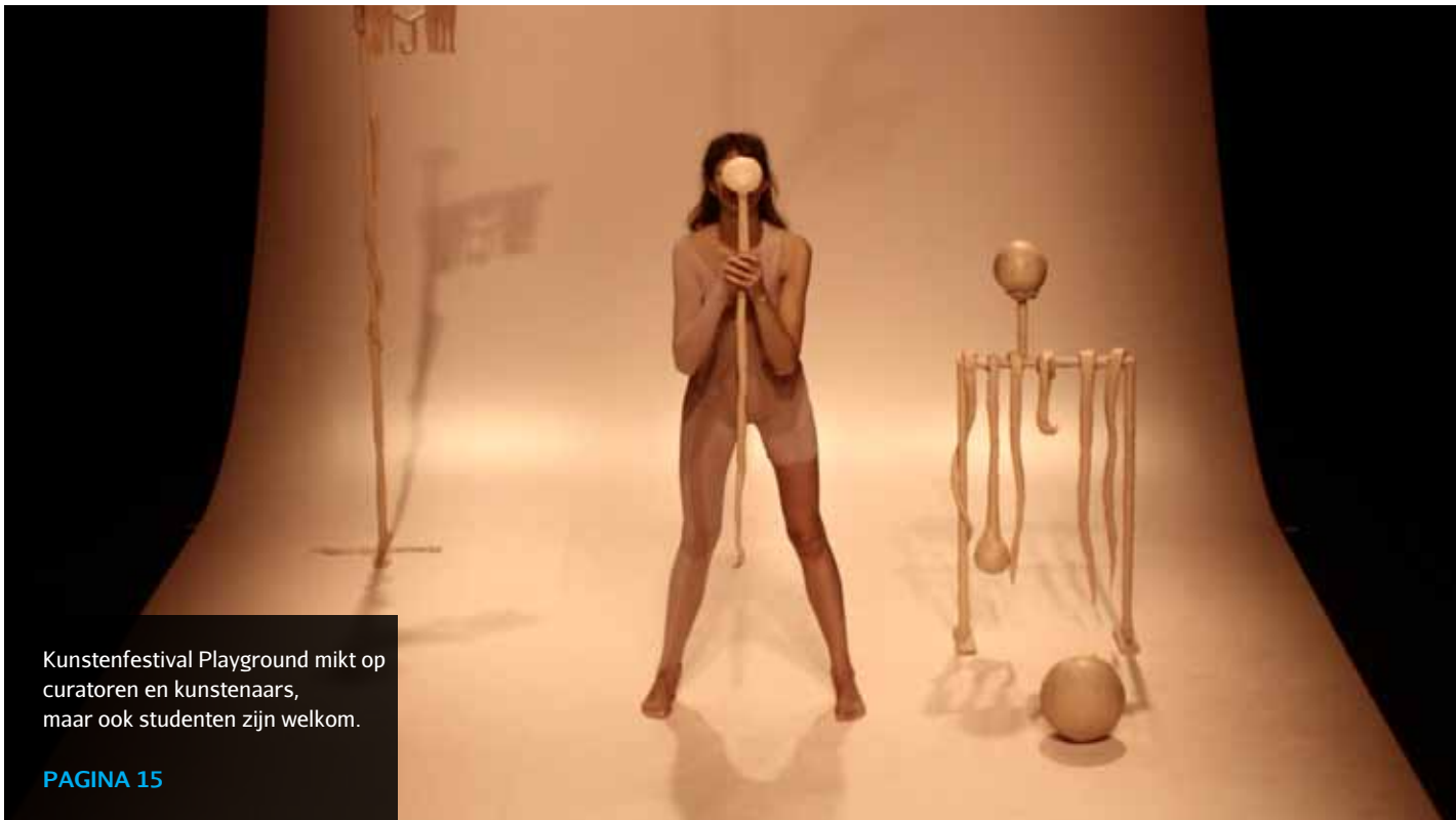
Kunstenfestival Playground mikt op curatoren en kunstenaars, maar ook studenten zijn welkom.