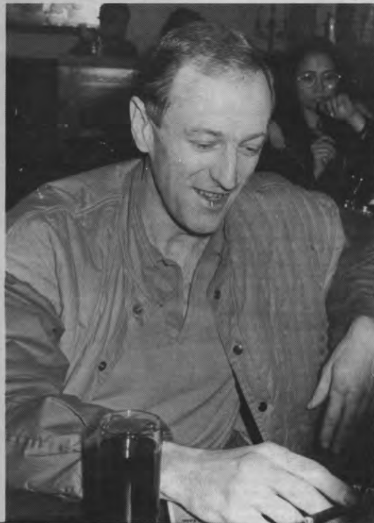
GRAHAM - Deze man is ni meer. Net nu ons lijfblad Panorama zich eens lekker vrolijk had gemaakt over de ruggemerkanker van Monty Python's Chapman, gaat hij de pijp uit. Kan blijkbaar ook ni tegen een grapje. Ni.