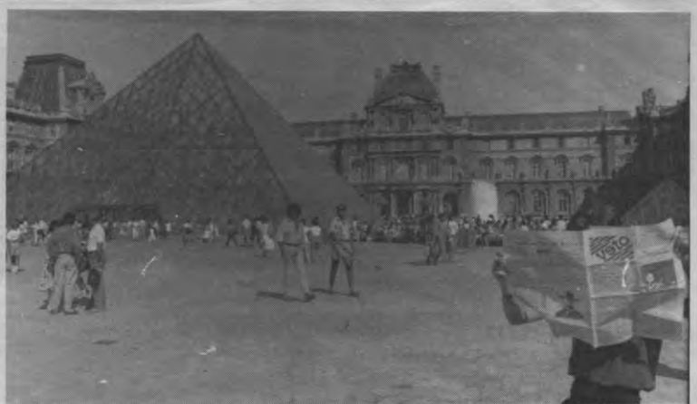
TALENT - We kunnen er echt niet over zwijgen, dat Veto-weekend in Parijs: die ekskieze zalmsoefflee, dat gebraden everzwijn, de overvloedige sjampanje. We zijn er nog altijd een beetje opgelaten van. Daarom, en alleen daarom, zijn we op zoek naar jong talent: schrijvers, fotografen, tekenaars, lay-outers en zettters. Dit is uw laatste kans om gelanceerd te worden.

Die eenheidstal hoeft natuurlijk niet het Engels te zijn. Dat Frankrijk na jaren dwars te hebben gelegen nu fel pro-Europees geworden is, komt mede door de hoop om via Europa aan het Frans een nieuwe internationale rol te geven. Een ander alternatief is het Esperanto.