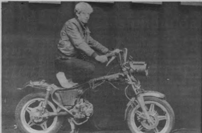
Je moto, je vrijheid. Behalve als je erop gaat stijdansen natuurlijk.