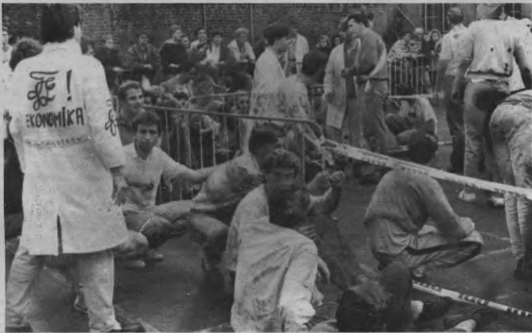
Neen, eerste-kenners, lang zullen jullie niet meer lachen. Weldra zijn de partieels daar. En dat is afzien, lijden. Ketchup, zweet en tranen.