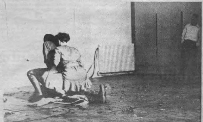
Volgens de kenners die wij geraadpleegd hebben, is dit de vuzigste scène waarvan u dit jaar op het Klapstuk kan genieten. Platel op zijn plaats. Maar wel artistiek natuurlijk.