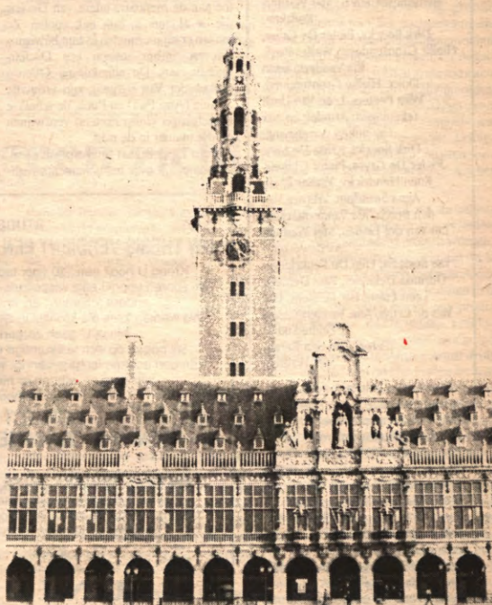
Deze week op de middenpagina's: deel twee van de biblioteeksaga.