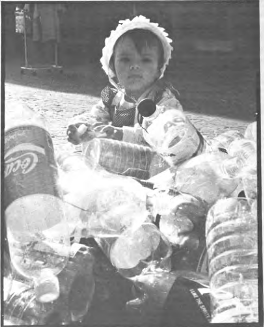
De afval-aktie was de blikvanger van het tweede luik van 'Konsuminderen', de groene aktieweek. Op een ludieke manier toonden milieubewuste studenten, die zich gegroepeerd hebben in Genoeg!, aan dat het afvalprobleem in onze maatschappij zulke proporties heeft aangenomen dat men er niet meer omheen kan kijken. Het stadsbestuur moet dringend haar verantwoordelijkheid opnemen en dat doe je niet door de bollenparken te laten verdwijnen.