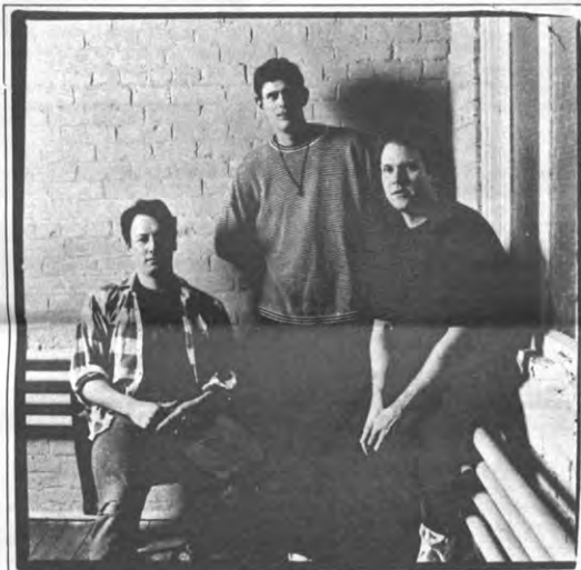
De vzw Folkpodium sluit dit academiejaar op 6 mei af met een concert van het Hongaarse folkgezelschap The Zengo Group. De groep tracht een ontmoetingsplaats te zijn voor moderne en traditionele muziekvormen, altijd gespeeld op akoestische instrumenten. Hun concerten eindigen met wat ze noemen 'The Dance House', waarbij ze het publiek tot dansen trachten aan te zetten. Te zien om 20.30 u in zaal Den Dooleeg te Egenhoven/Heverlee.