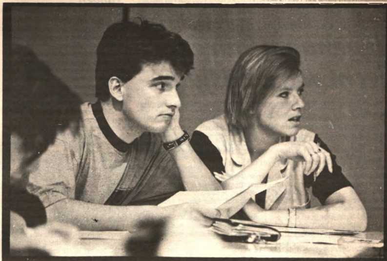
De VRG-fractie op de OAV

Deze OAV was echter helemaal niet aangevraagd, maar gewoon gepland op het einde van de vorige. Nu lijkt het logisch dat een discussie verder ge-