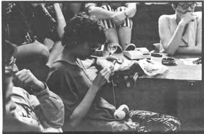
Als je ooit naar een Katechetikadebat gaat breng dan twee breipriemen en wol mee, het kan er daar gezellig aan toe gaan. (Wij hadden onze breipriemen thuis gelaten).