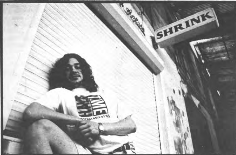
Hoe een beetje sekspeel een suksesstory verzekert...