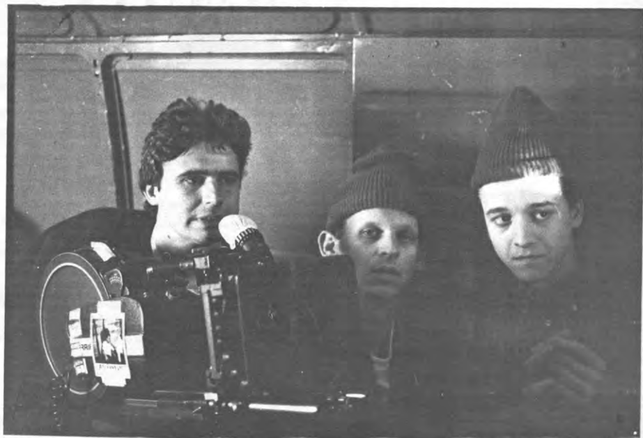
Ik ga niet van het dak schreeuwen dat dit een betere film is dan Boys.

«De hoofdpersonages zijn geen types die in principe iets tegen dopen hebben. Ze denken: we gaan het eens verkennen. Dat is een houding die vele studenten hebben denk ik. Zo van je