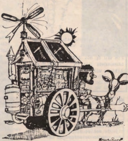
(in Undercurrents 12)

Centraal stellen we echter steeds dat de wetenschap in die dienst moet staan van de mens en de globale mensheid voor ogen moet nemen, en verder dat we haar voor de gewone leek moeten verstaanbaar maken.