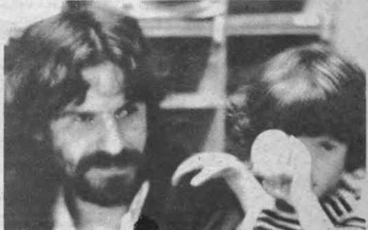
Vader en zoon: geen gezin, oordeelt de RVA.

De beslissing van bepaalde kringen om uit de ASR te treden werd afgekeurd. Zij kunnen wel blijven deelnemen aan sportmanifestaties en competities, maar verliezen hun stem- en subsidiericht. Men vindt het immers verkeerd dat kringen die het 'slechte' willen vermijden, wel nog van het goede zouden profiteren.