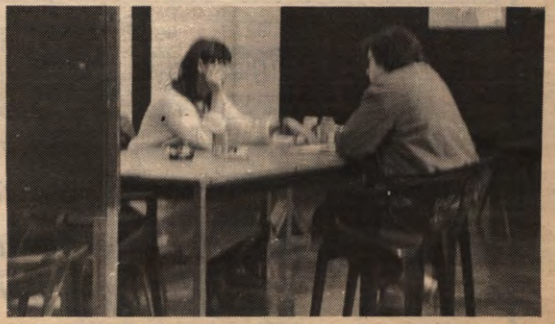
Keiharde onderhandelingen tussen een werkgever en een student.