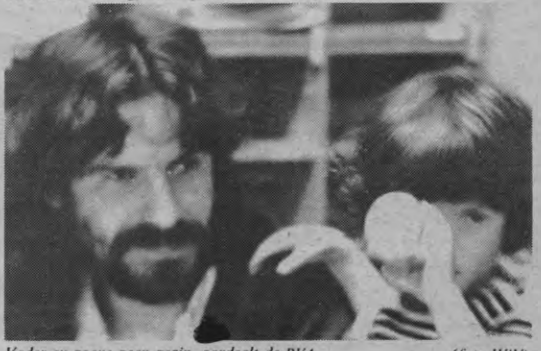
Vader en zoon: geen gezin, oordeelt de RVA.

De beslissing van bepaalde kringen om uit de ASR te treden werd afgekeurd. Zij kunnen wel blijven deelnemen aan sportmanifestaties en competities, maar verliezen hun stem- en subsidie-recht. Men vindt het immers verkeerd dat kringen die het 'slechte' willen vermijden, wel nog van het goede zouden profiteren.