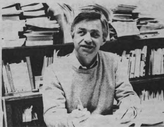
Prof. Leirman van Pedagogie gaf uitleg bij een experiment dat reeds sinds '75 loopt binnen zijn fakulteit: Projektonderwijs.

Een laatste aspect dat hiermee in verband staat, betreft de organisatie van de universiteiten. Nu is deze