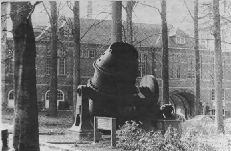
'Dergelijke kanonnen maakt men in het departement Metaalkunde niet meer.'

Het derde deel van de brochure bevat een repliek op de brief die een aantal WP-ers van het Departement Metaalkunde in Veto (27/3/83) afdrukten, m.b.t. dit thema. Uit deze brief worden twee stellingen namelikh. In eerste instantie hadden de WP-ers betoogd dat je een bedrijf niet van kollaboratie