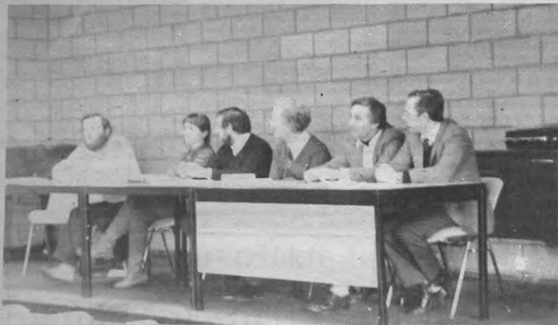
Op de studiedag had er ook een panelgesprek plaats met begeleiders van leerprojecten en vertegenwoordigers van studenten, over vernieuwingsstrategieën.