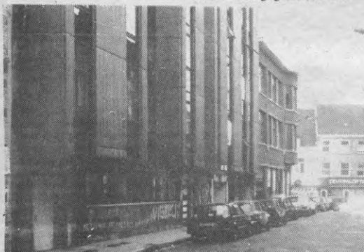
De Sedes, bekende meisjespeda in de Vlamingenstraat.