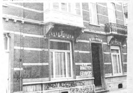
Wanneer wordt het CVP-hoofdkwartier te Leuven bezet?