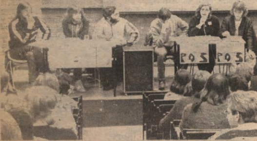
Ploegen Schwung en Plots bij het verkiezingsdebat in Pol & Sok.

De lente is weer in zicht en daar komen de kringverkiezingen weer aan. Waar de lente na 3 maand weg is, hebben de kringverkiezingen volgend jaar echter nog een sterke impact. Veto vindt het dan ook belangrijk genoeg deze boeiende activiteiten op de voet te volgen. De volgende weken geven wij een beeld van het nieuwe presidiumwereldje. Vandaag beperken wij ons tot een algemene achtergrond en één concreet voorbeeld.