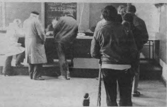
Van de infobeurs recht naar dit stempellokaal?

Werd 1983 de grote doorbraak? Kwamen er fundamentele vernieuwen-