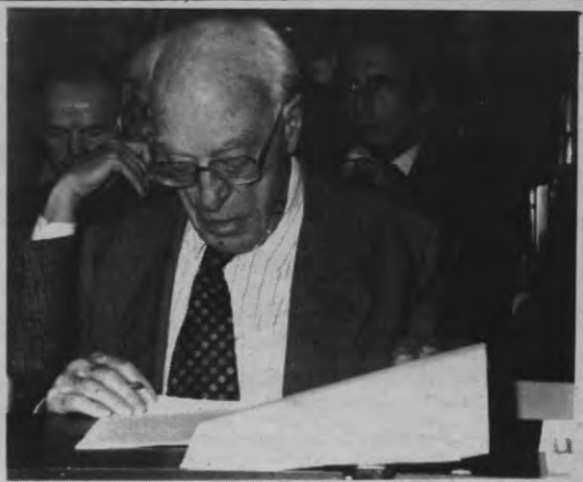
Sir John Eccles heeft hersenen te veel. Een transplantatie naar het hoofd van psychologen wordt echter niet overwogen.

De drie neurofysiologen waren het over de grond van de zaak opvallend eens, zij het met nuanceverschillen: John Eccles is een radikaal aanhanger van het dualisme; voor hem is het menselijk brein het resultaat van de natuurlijke evolutie, de menselijke geest daarentegen is een goddelijke schepping die elk van ons uniek maakt en die op de wereld inwerkt via het brein. Janos Szentagothay was iets minder radikaal; hij noemde zich een kristen en aanvaardde dus een mense-