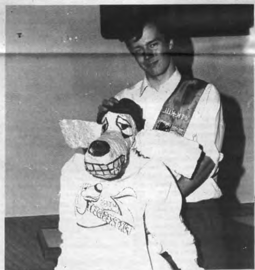
Dit is dan de nieuwe preses van VTK, met een naam als een hond, maar met een programma dat klinkt als een...

Zwoef is in VTK geen nieuw gezicht; hij was al enkele malen vertegen-