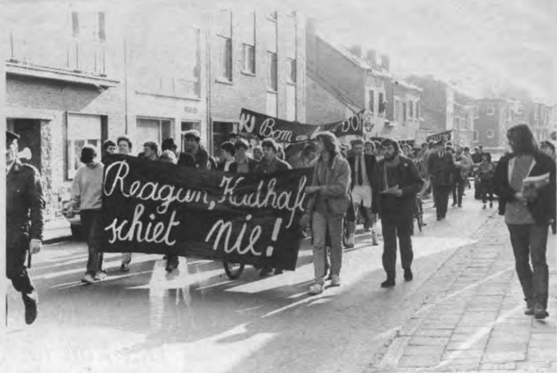
BETOGING — Vorige donderdag organiseerde een ad hoc in het leven geroepen Werkgroep Kritische Studenten een betoging tegen de aanval van Reagan op Libië. De opkomst viel nogal tegen: slechts een kleine 100 man vond het de moeite waard, en veel meer dan het klassieke betogersklubje hebben we niet gezien. Intussen vraagt iedereen zich af welke 'duistere organisatie' schuilgaat achter de organiserende Werkgroep. Tegenwoordig heeft Kringraad al een pseudoniem nodig om betogingen te organiseren...