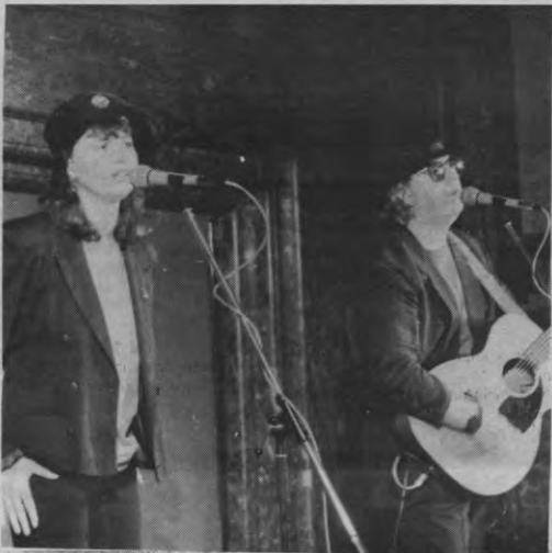
Dit welgevormd meisje met fonkelende oogjes gaf met deze muppetster een zeer gesmaakt optreden in de Stadsschouwburg. Dat ze zelfs een mening hebben lees je in het artikel hiernaast.