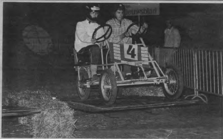
Zie die atleten, die strakke, afgetrainde lichamen, één en al spieren. Maar ook die wazige blik in de ogen. En vorig jaar nog slapjanussen. Medika wint de Kwistax? Doping ja.