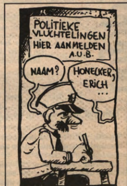
VVVV vluchtelingen: pag. 3 én 7.