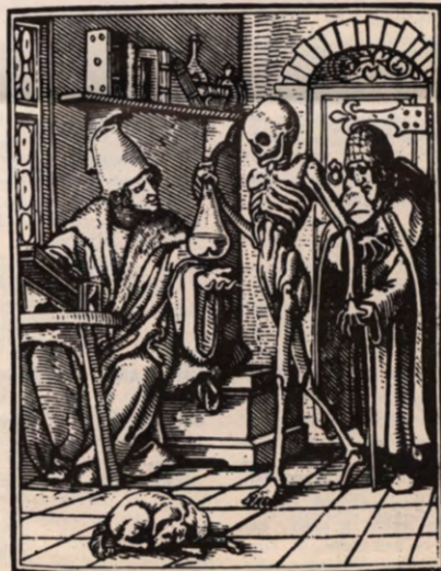
Zieke leden? Kranke geest? De dokter heeft voor elke griep een pil.