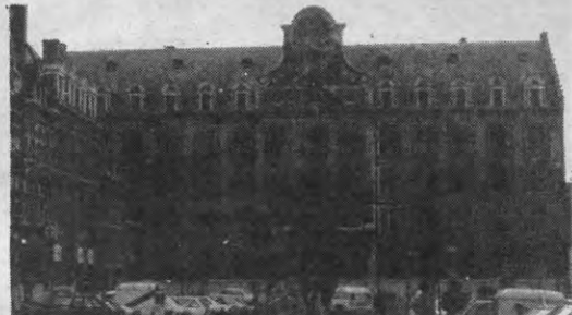
Het Jozefietenkollege op de Oude Markt is voor vele aggregaatsstudenten het enige kontaktpunt met de praktijk. De V.I.R. wil daarin verandering brengen.

tot het sekundaere onderwijs, houdt men zijn hart vast indien de evaluatie van de debuterende leerkracht zou geschieden tegen een achtergrond van toenemende verzeping. Men wil klaar zien in de konsekventies ervan, voor men achter een dergelijk voorstel gaat staan.