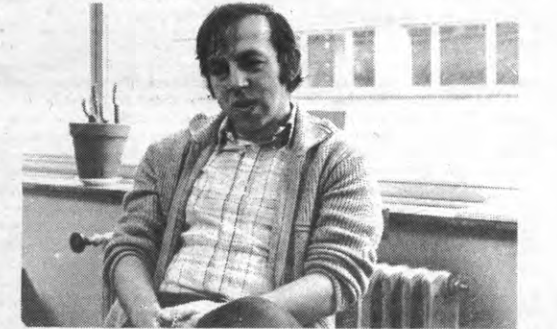
«Het huidige systeem moedigt het individualisme aan en bevestigt bepaalde machtsverhoudingen.»