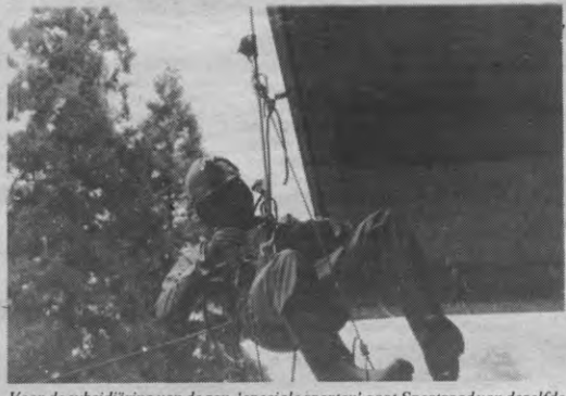
Voor de subsidiëring van de zgn. 'speciale sporten' gaat Sportraad van dezelfde filosofie uit als voor haar eigen activiteiten: de subsidie moet gebruikt worden om die sporten toegankelijk te maken voor alle studenten.

«Van in het sportsekretariaat kan je zeer veel zien evolueren», lacht Chris mysterieus. Hij beweert van één en