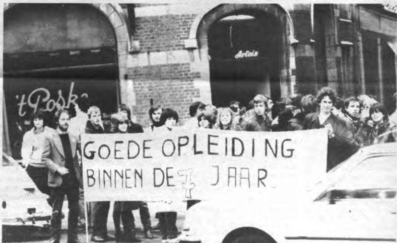
De overheid is niet erg geneigd om met het studentenstandpunt rekening te houden. De Waalse geneeskunde-studenten hebben zich daarom al verplicht gevoeld de forfaitaire betoelaging te aanvaarden, in de hoop daarmee een vestigingwet of een N.C. op het einde van hun studies te vermijden.