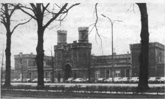
Belgische gevangnissen op een rijtje. Toch gaat het nog niet om Chili in België.