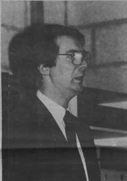
Gerard Mortier is een van de jongste opera-directeurs ter wereld. Vorige week woensdag (23 januari) was hij te gast bij de Kring voor Internationale Betrekkingen. Volgende maandag zit hij weer te Leuven (zie agenda). In één der volgende Veto's laten wij zijn visies kristalliseren in een mooi artikeltje.

Dat neemt niet weg dat de overeenkomsten tussen disco en repetitieve