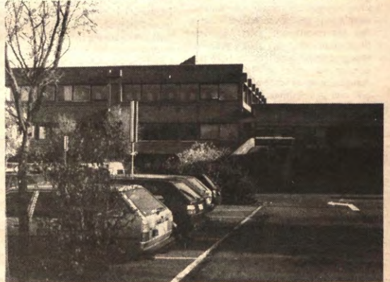
Gier zetten de Westvlaamse profs onder karre.

En dan is er het fameuze studentendorp. Op een boogscheut van de kampusgebouwen staan hier acht huisjes geplant. Ze zijn van het type Bobbejaanland, zoets als die knusse snelwegrestaurants in Zuid-Frankrijk met gebouwtjes van steen en hout. En peperduur: 70 miljoen voor amper 70 kamers. Drie van de acht huizen worden door meisjes bewoond. De