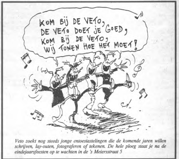
Veto zoekt nog steeds jonge entoesiastelingen die de komende jaren willen schrijven, lay-outen, fotograferen of tekenen. De hele ploeg staat je na de eindejaarsfeesten op te wachten in de 's Meiersstraat 5