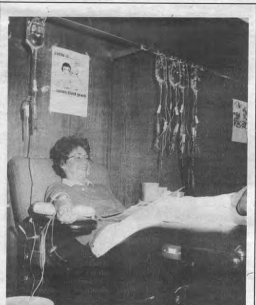
BLOEDINZAMELING - Op dinsdag 18 december organiseren de Landbouwkring en het Rode Kruis een bloedinzameling in het Arenbergkasteel en in de Valk. Er is bovendien de ganse dag info en randinmatie voorzien op het Ladeuzeplein. 's Avonds vindt een happening plaats met talent van eigen bodem. Als bloedgever mag je erin voor 100 fr. Anders kost het gebeuren je 250 fr. in voorverkoop of 300 fr. aan de kassa.