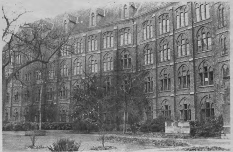
Het gevaar bestaat dat de beleidsdrift van de KUL straks weerspiegeld wordt in haar huisvestingspolitiek.

Een vierde uitbreidingsmogelijkheid lijkt iets moeilijker te liggen. Vanaf 1 mei