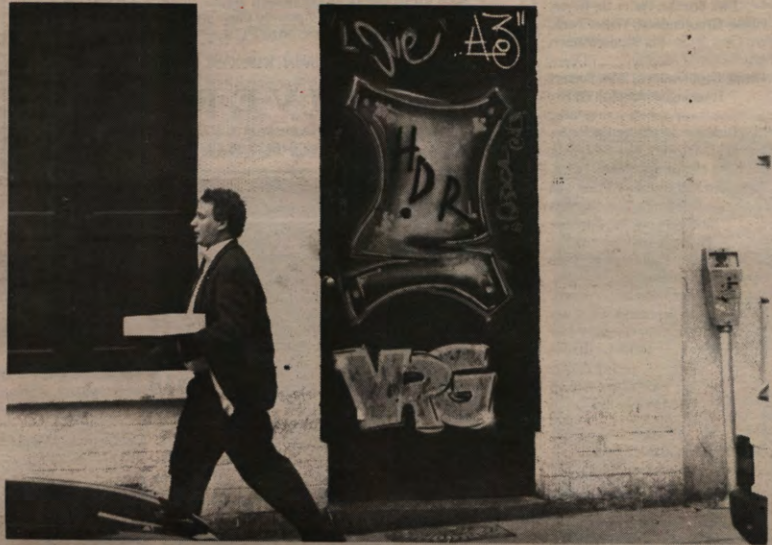
Enkele kring-kafes worden opnieuw met sluiting bedreigd. De deur van het Huis der Rechten blijft voorlopig in elk geval dicht.

STUDENTENWEEKBLAD VAN DE LEUVENSE OVERKOEPELENDE KRINGORGANISATIE - JAARGANG 17, 1990-1991, NUMMER 26, MAANDAG 22 APRIL 1991