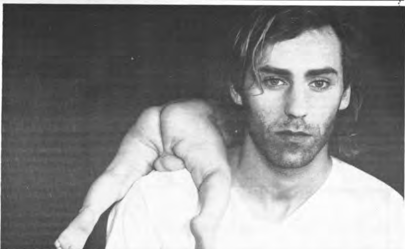
Tuuuuuuuuuuuuuu. Wit vierkantje.

In tegenstelling tot wat de tegenstanders op dat moment dachten, kiest Toergenjev niet onvoorwaardelijk partij voor het gedachtegoed van Bazarov. Hij wijst net zo goed op zijn natieve