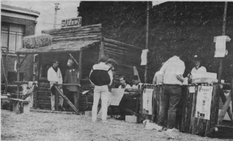
Vorige week kon je in Leuven blauwe bonen halen in de Saloon of rodeoheid worden op de rug van een mechanische stier. Allemaal in het Far West-dorp van Industria.