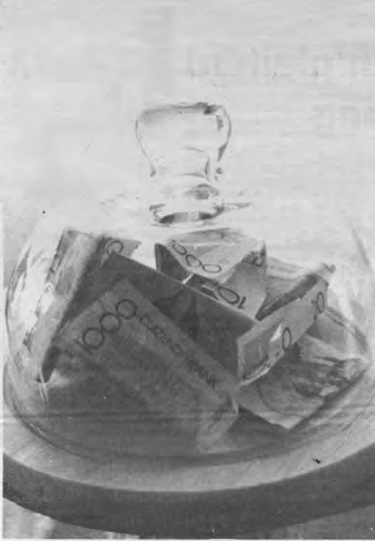
We nemen echter niet aan dat de CVP, SP, Volksunie of PVV anno '79 erg "kommunistisch" geïntendeerd waren.

De controverse rond de studietoelagen is echter te belangrijk om na één week te vergeten en dan zonder meer te laten passeren, of af te wachten tot in juni of juli de minister van onderwijs uitpakt met zijn hervorming van de studietoelagen. Daarom brengt Veto deze week een uitgebreid 'dossier studiebeurzen'.