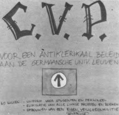
Het nieuwe logo van de GUL.