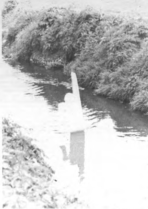
Warempel, een ventje in de sloot.

Ten to go werd tijdens de verkiezingen trouwens 'gestraft': alle stemmen die op ontvingen van studenten uit de eerste drie jaren werden ongeldig verklaard.