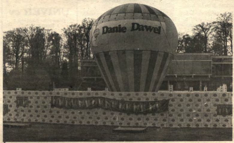
Dan had je de verkiezingscampagne van de Klotten en de Historianen moeten zien.

Leidinggevende persoonlijkheid, inzicht in rational behaviour, eerzucht, morele kracht, honderd procent loyaal, zelfzeker, in het bezit van een wagen, energie, 'Master in Thomistic Philosophy'. Laat die jongen aan ons voorbijgaan. Geen van de drie kandidaten konden ons overtuigen. Daarom houden we het deze week toch liever bij de kringverkiezingen. En omdat wij het zijn, tasten we nog even in uw beurs. Als uw studie u ook lief is, lezen we even die katern in 't midden.