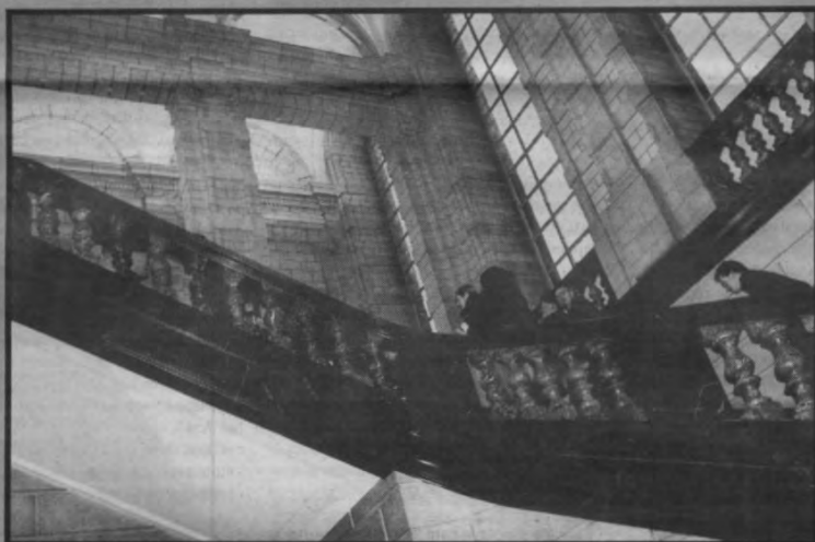
's Nachts na tweeën, dan gaan we met z'n allen...

Met deze prikactie heeft de studentenbeweging getoond dat het haar menens is met de door haar geformuleerde eisen. Het is onaantvaardbaar dat men voor bepaalde VAO's fors verhoogde inschrijvingsgelden moet neertellen. Het leit dat men steeds vaker opleidingen kumuleert om nog een kans te maken op de arbeidsmarkt — een tendens die de Leuvense