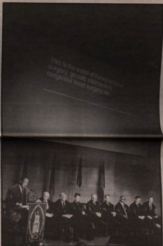
Maandag reikte de KU Leuven haar eredoktoraten uit: u leest er alles over op pagina 3.

This is the world of transplantation surgery, genetic intervention, congenital heart surgery etc